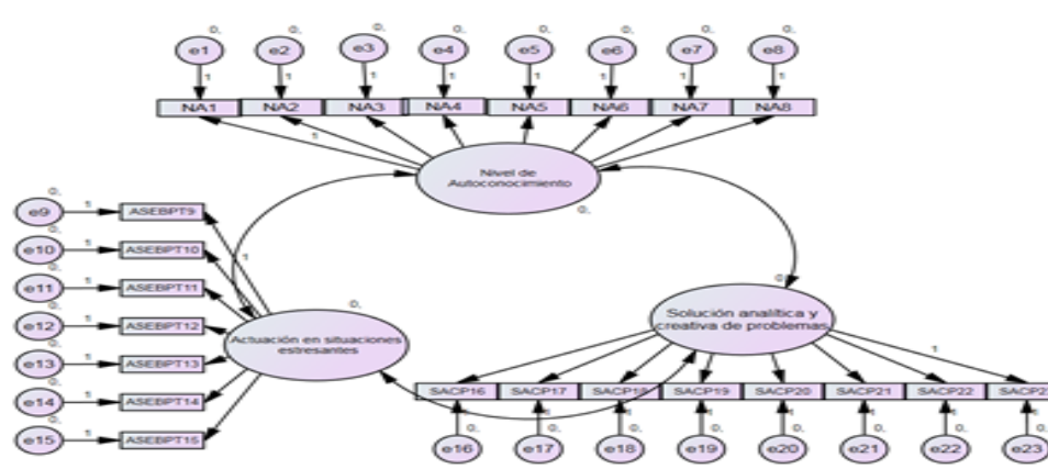
Figura 1. Modelo de estructura

Finalmente, los resultados del Análisis Factorial Confirmatorio y el método de máxima verosimilitud en el software AMOS 23, confirma que los constructos Nivel de autoconocimiento, Actuación en situaciones estresante y Solución analítica y creativa de problema tuvieron problemas de estructura, por lo que se tuvo que realizar ajustes al modelo original propuesto en la Figura 1.