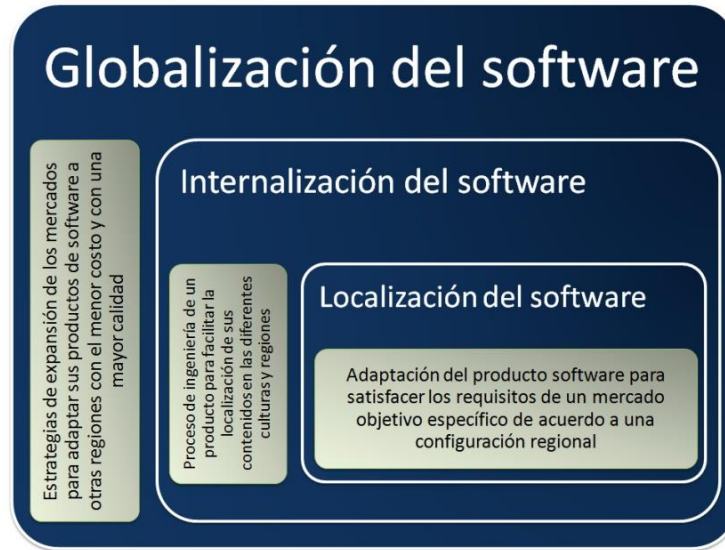
Figura 1. Procesos claves de la globalización del software

LISA (Localization Industry Standards Association (LISA), 2007) presenta estos dos procesos claves de la globalización, como partes que se complementan entre sí dentro del ciclo de desarrollo de un producto de software (Fig. 2). Por ello es preciso que tanto la internacionalización como la localización, requieran de una apropiada planificación dentro del proceso de desarrollo de software convencional para que sea posible la producción de un producto global. Esto conlleva a que las instituciones que producen software deban convertir su proceso de desarrollo convencional en un proceso de desarrollo internacionalizado, donde se incluyen además las etapas de soporte y mantenimiento de acuerdo a las necesidades del mercado.