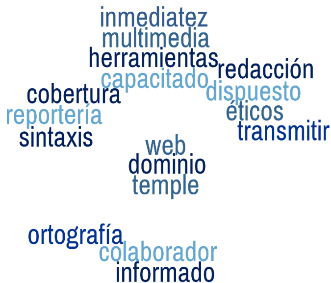
Figura 1. Terminología requerida para forjar un perfil periodístico idóneo.

Así como el profesional se va especializando en determinadas áreas, las audiencias viven similar transformación y los niveles de exigencia de información son mayores. Ir a ese ritmo de adaptaciones y cambios también representa un beneficio para que el periodista que encuentra oportunidades en el campo laboral o crean otras, con el soporte de las plataformas digitales.